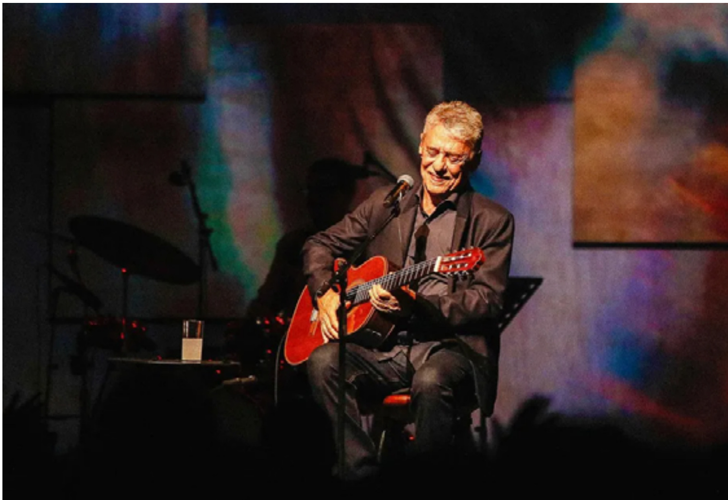
Palavras: Chico Buarque é cronista de tantas sensações vividas pelos fãs