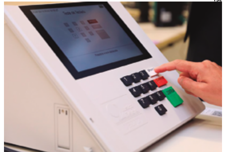
Janela de 6 de março a 6 de abril; convenções, 20 de julho a 5 de agosto

O secretário de Educação é natural de São Paulo e, muito cedo, veio para Goiás. Foi aluno de escola pública. Seguiu os passos dos pais e se tornou professor. Em Anápolis graduou-se em Ciências Sociais e Direito. Na faculdade foi atraído pelo movimento estudantil. No serviço público conta com mais de vinte anos de trabalho. Foi diretor da Companhia Municipal de Trânsito e Transportes (CMTT), e secretário de Indústria e Comércio, e de Educação. Em 2016 foi candidato a vereador pelo PTB, obteve 1.382 votos e ficou na suplência. Em 2020, no PP, se elegeu vereador com 1.753 votos.