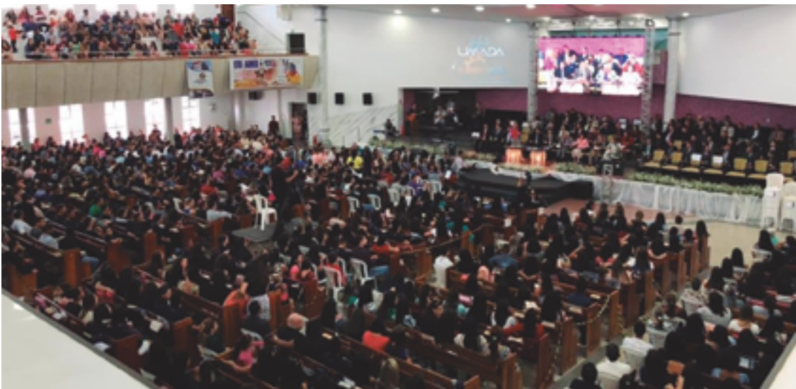
Anápolis se tornou conhecida como uma das cidades brasileiras que contam com maior número de cristãos

“As igrejas precisam focar mais no trabalho social, em cuidar mais das pessoas, acompanhar mais de perto. Muitas igrejas já o fizeram, têm visitado, se preocupado