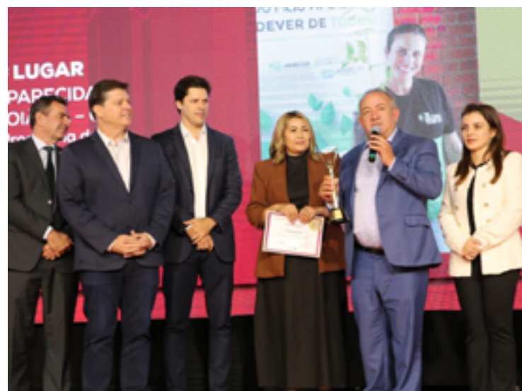
Projeto de Reestruturação Urbana da Bacia do Ribeirão Santo Antônio foi o escolhido dentre cinco cidades nacionais. Cidade também foi destaque no quesito sustentabilidade

Ao todo, são 10 eixos interligando a cidade, desafogando o trânsito, melhorando a locomoção e a qualidade de vida dos moradores. Durante a gestão de Maguito foram entregues os eixos Norte-Sul 1, 3 e 5.