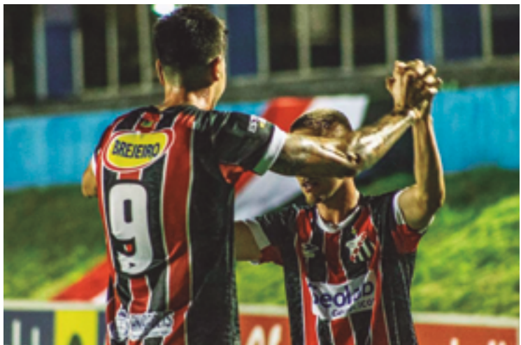
O Tricolor é o único representante da cidade na elite do futebol goiano

Anápolis Futebol Clube, que chegou às semifinais na temporada de 2023, joga em casa na segunda rodada contra o Vila Nova