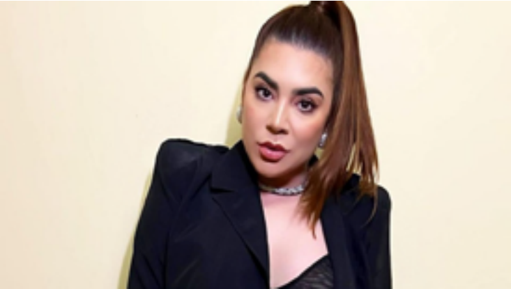
Socorro: cantora foi atendida e caso encaminhado à Deam

Ex-participante do Big Brother Brasil, Naiara Azevedo alega ter sido vítima de violência doméstica