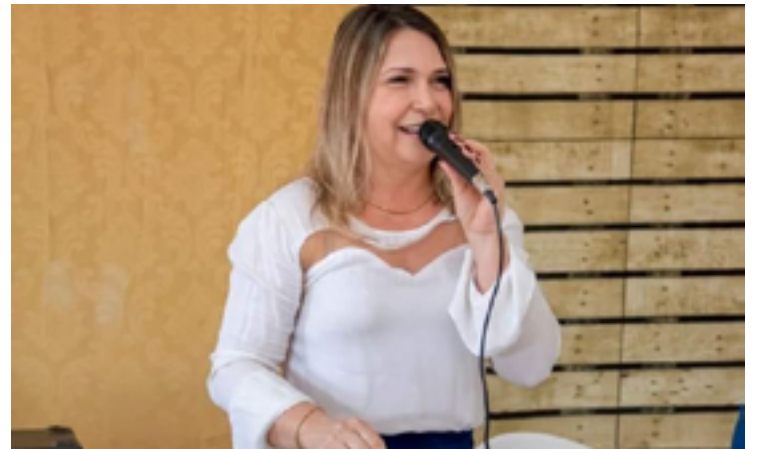
Maysa Peixoto: pronta para assumir a prefeitura