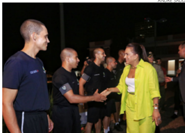
Governador Ronaldo Caiado e Gracinha receberam os alunos em formação da Polícia Militar

Para o comandante-geral da PMGO, André Avelar, os novos alunos representam os resultados dos investimentos do Governo de Goiás. “A Polícia Militar hoje vive um momento único de vontade, de motivação, de trabalho nas ruas no combate à criminalidade, graças aos investimentos do Estado e apoio do governador Ronaldo Caiado”, destacou.