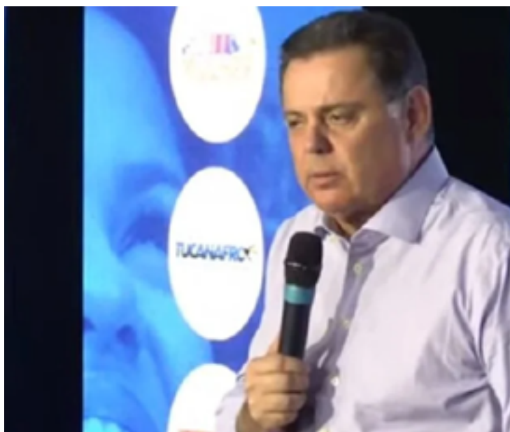
Marconi Perillo: missão principal é a de reoxigenar o PSDB após sucessivas derrotas

Perillo assume a sigla no lugar do governador do Rio Grande do Sul, Eduardo Leite, que decidiu deixar o cargo após nove meses com a justificativa oficial de que precisa se dedicar ao governo estadual. Leite, porém, também acumulou atritos ao promover intervenções nos diretórios da legenda na capital paulista e no Estado. A expectativa é que ele seja candidato à Presidência da República, em 2026.